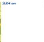
Záručná kľučka 22"