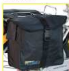
Potravná taška preľah