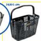
Kotlík s mrežou a kľúčom (dĺžka 34,80 € + DPH)