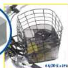
Kotlík s mrežou pre ľavú stranu