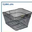
Kotlík z zadného nosiča